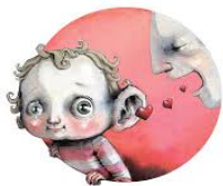
ILL.: LISA AISATO

Omsorg ligger i bunn for alt vi gjør i barnehagen. De ansatte skal gjennom ord og handling vise omsorg for barna, for foreldrene og for hverandre, og også videre for samfunnet og naturen rundt oss. Basert på barnas alder, personlighet og utvikling skal personalet tilpasse sin uttrykksmåte og være bevisste på hvordan vi oppfatter barnas signaler slik at alle barn opplever å bli sett og forstått.