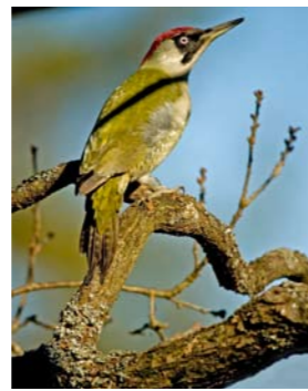
Grønnspekk. Foto: Bård Bredesen. Midten: Skråfoto av Nordskogen fra sjøen i nordvest. Kartgrunnlag: ©GEOVEKST Tillatelsesnr: GV-F-9