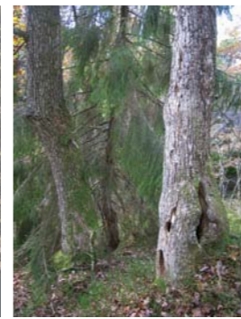
Grove eiker. Hullene nederst er etter svartspett på næringsjakt.